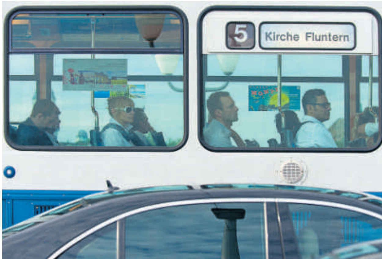
In der Stadt Zürich soll der öffentliche Verkehr noch deutlicher über die Autos gestellt werden.

QUELLE: STADT ZÜRICH NZZ-INFOGRAFIK / tcf.